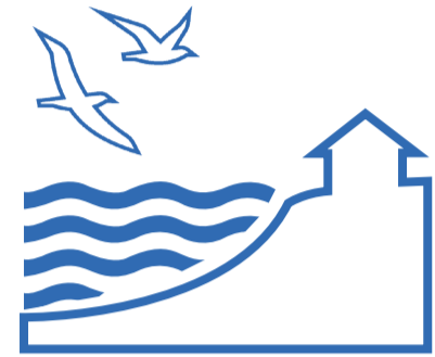
สมุทรปราการ